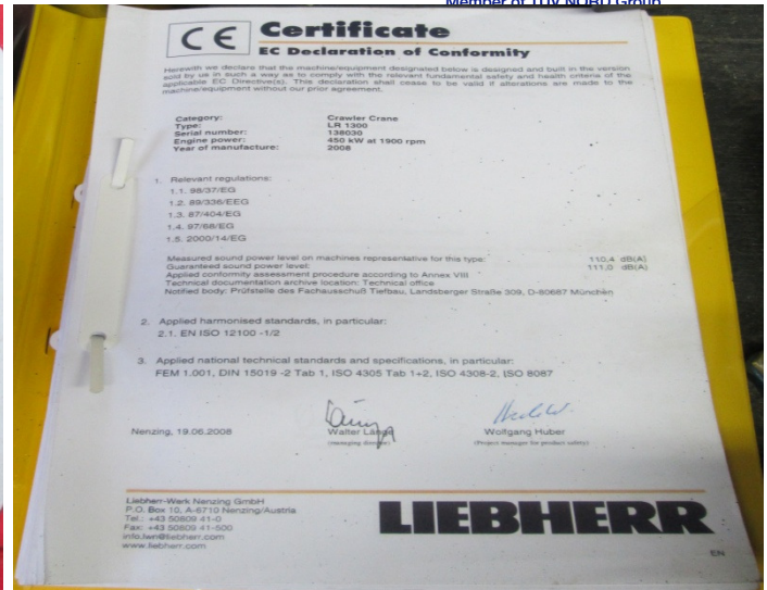
Bijlage 1 verklaring van overeenkomst