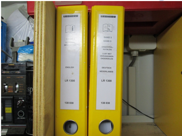
Instructieboeken bijlage 2