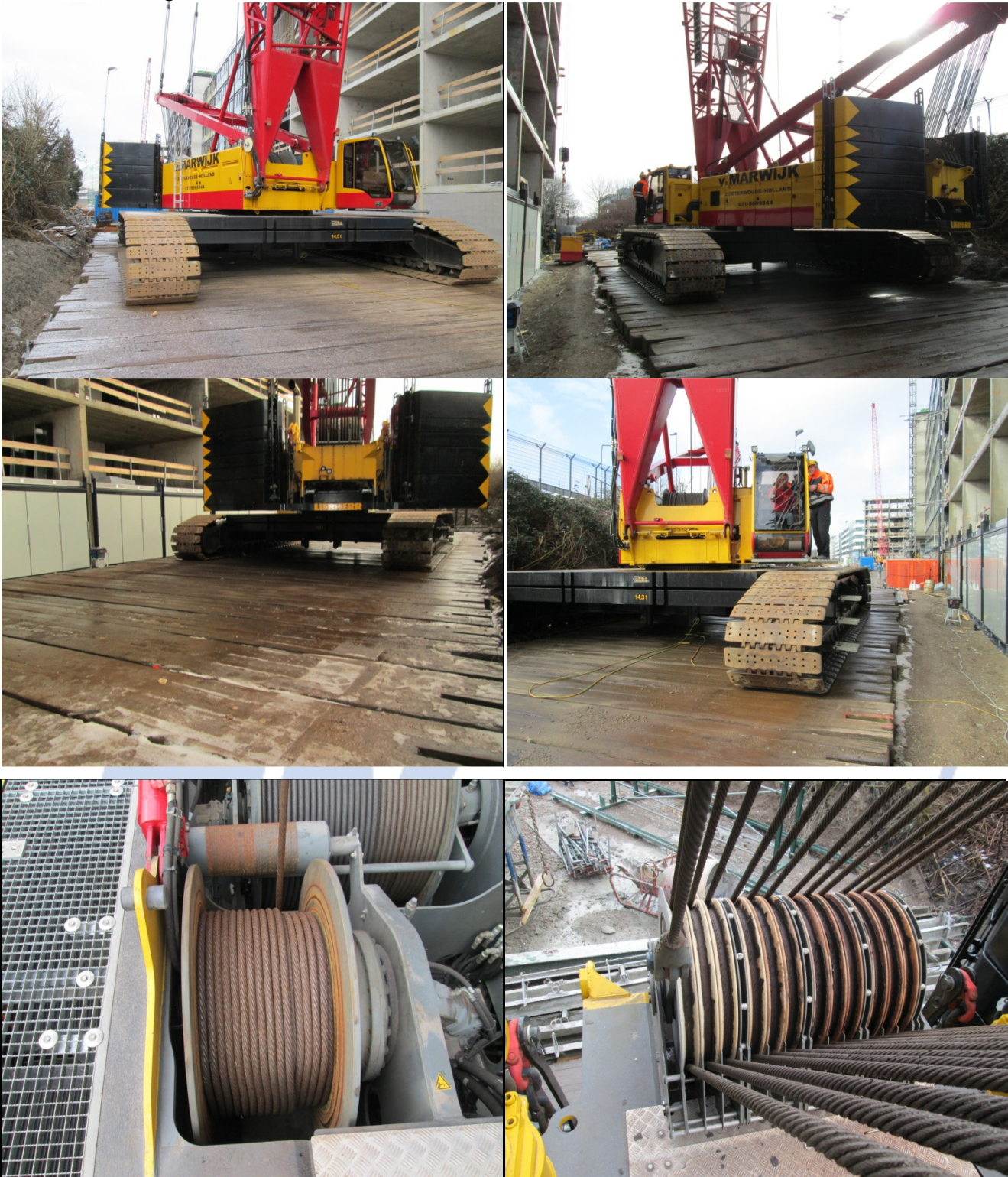
Foto overzicht algemeen.