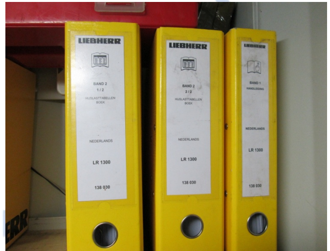
Hijstabelen bijlage 2